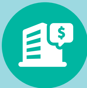
CRÉDITOS COMERCIALES Y LEASING